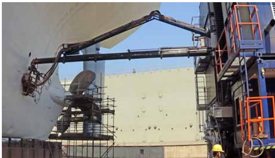
Für Abtrag und Beschichtung verfügt das HTC-SD über zwei Schubarme.

Palfinger Systems GmbH Vogelweiderstrasse 40a A-5020 Salzburg Tel. +43 662-880033-0 www.palfingersystems.com