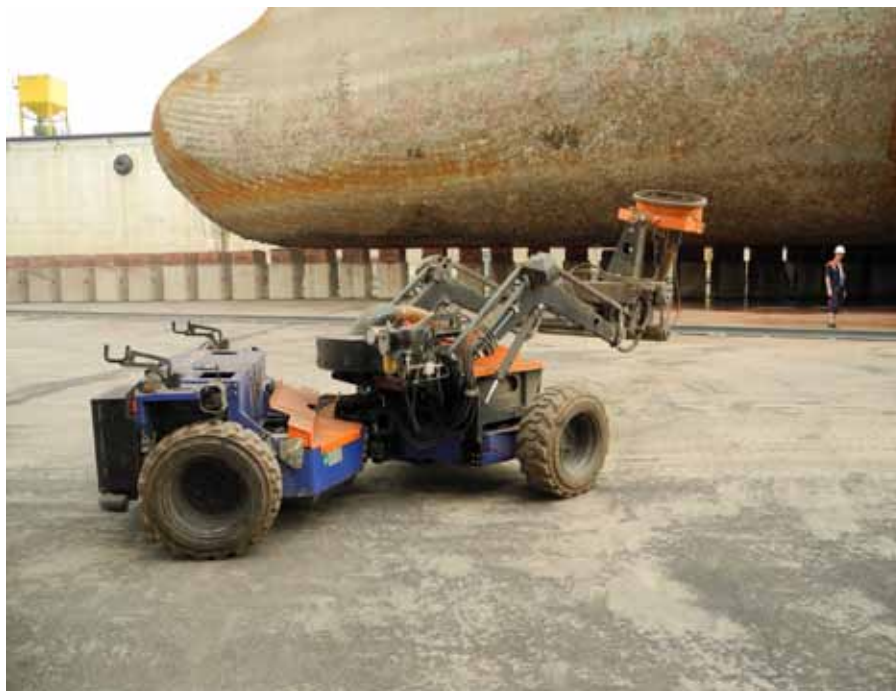
Der Behandlung der Schiffsunterseite dient der ebenfalls von Palfinger systems entwickelte HTC-BT (Bottom Treatment).